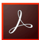
Adobe Acrobat DC